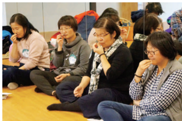
由葡萄乾禪切入，進而導入呼吸與靜坐，學習如何和自己的對話，以及練習活在當下。