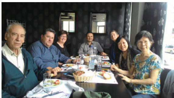
義工團隊的成員來自美國、墨西哥與臺灣。