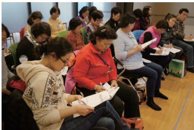
劉醫師提醒照護者身邊仍有許多好用卻容易忽略的資源。

減壓，是學習更好的照護技巧，是更愛自己，更是活在當下。最後仍要叮嚀照護者們，不要害怕讓自己幸福，當你幸福了，你的親人也會更幸福。也要記得照顧好身體裡的醫生「自癒力」，讓自己能健康、幸福到生命的最後一刻。