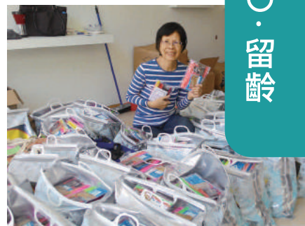
在工作室分裝救助福音包

發送物資。當車子開進Katsika難民營開始發放福音包時，一群孩子立刻圍了過來，這群天真活潑的孩子，那一刻在鏡頭下留下了快樂的笑容。而接下來去位於山中Dolianna難民營，我們在營門口發放，也是一下子湧上許多的孩子，這個難民營有很多的小小孩，甚至是在襁褓中的嬰兒，他們似乎是有計畫地帶孩子們逃難，當我看到孩童們收到福音包的開心臉孔，一切的辛苦都值得了。