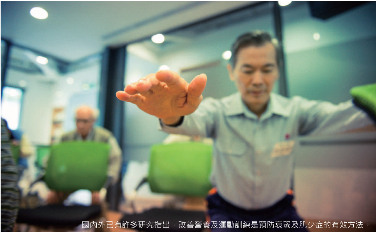
國內外已有許多研究指出，改善營養及運動訓練是預防衰弱及肌少症的有效方法。

或患病的絕對指標，但衰弱預防已成為先進國家高齡人口的衛生政策與健康促進活動的重點項目。根據各國的醫療研究結果以及流行病學調查分析，高齡衰弱人口的比例正在不斷增加，醫療體制需要重整變革，以因應高齡化社會的健康需求。